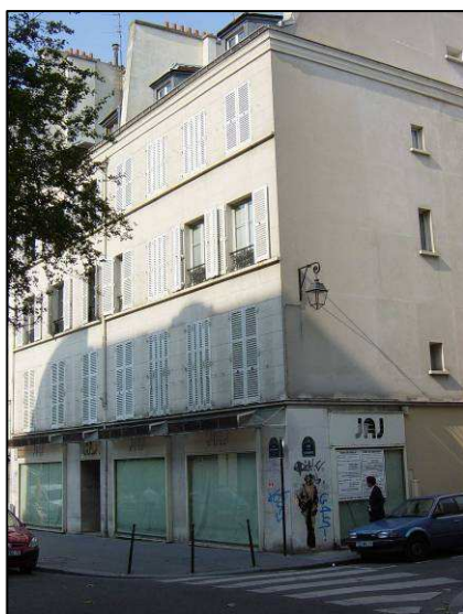
Angle Dupetit-Thouars / Corderie

16 logements locatifs et une crèche associative de 33 berceaux