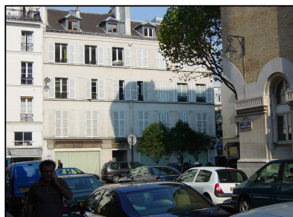
Façade rue Dupetit-Thouars